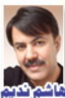
..... ہاشم ندیم .....

ہاشم ندیم نوجوان نسل کے پسندیدہ، ملک کے مقبول ترین ناول نگار ہیں۔ ان کی ادبی خدمات پر، حال ہی میں حکومت پاکستان نے تمغہ حسن کارکردگی دینے کا بھی اعلان کیا۔ ”مقدس“ ان کا پانچواں ناول ہے، جو جلد ہی ”The Sacred“ کے نام سے انگریزی ترجمے کی صورت میں بھی دست یاب ہوگا۔ مقدس سے پہلے ان کے ناول خدا اور محبت، بچپن کا دسمبر اور عبد اللہ بین الاقوامی پزیرائی و کامیابی حاصل کر چکے۔ زیر نظر ناول ”مقدس“ امریکا کے شہر، نیویارک اور نائن الیون کے سانحے کے پس منظر میں لکھا گیا ہے، جو یقیناً عبد اللہ ہی کی طرح اردو ادب میں اک مثبت تبدیلی، جدت و ندرت کا سبب اور کچھ نئے زاویوں، نئی جہتوں کی تلاش میں معاون ثابت ہوگا۔ آپ ناول نگار سے براہ راست رابطے کے لیے اس ایڈریس پر ای میل بھی کر سکتے ہیں۔