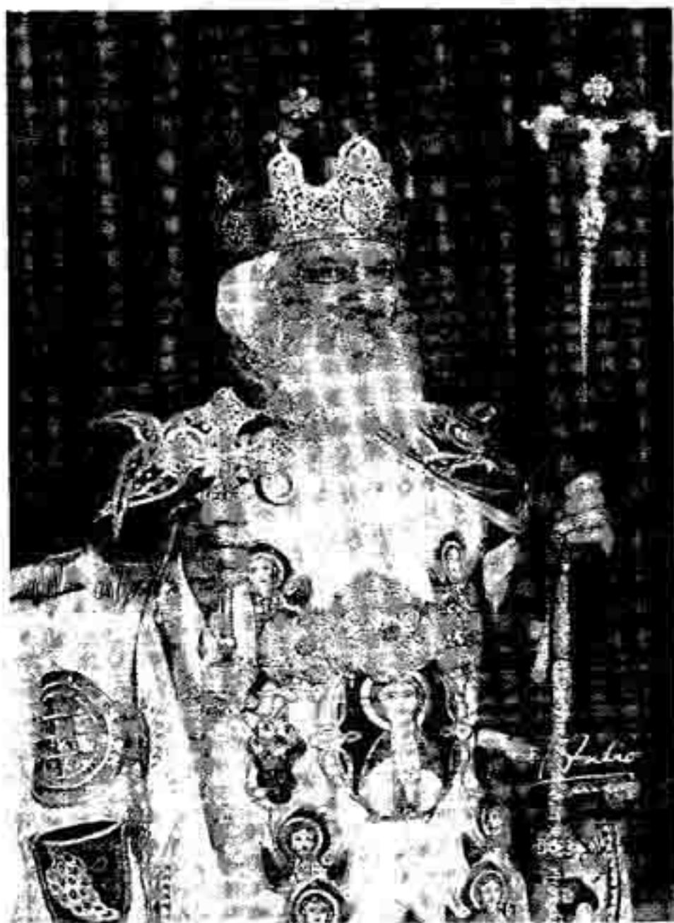
صاحب القداسة البابا شنودة الثالث بابا الإسكندرية وبطريك الكرازة المرقسية