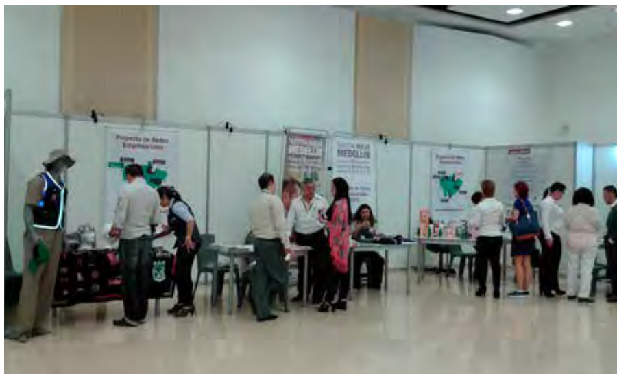
Redes de Confecciones, Dotación, Diseño Gráfico y Publicidad 2015. Redes de Tecnología y Turismo 2014.