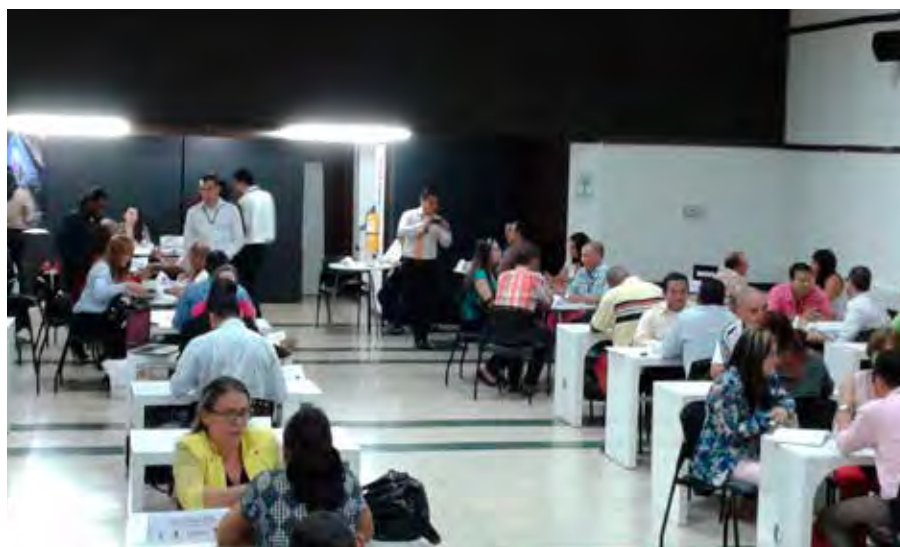
Primera Rueda de Relacionamento de Redes Empresariales.