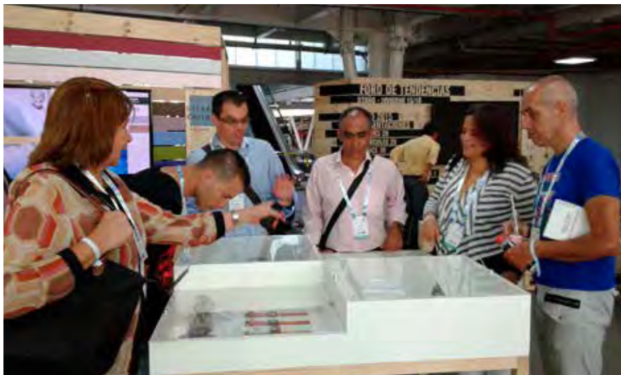
Empresarios de las redes de Textil, Confección y Moda.

Para ello los empresarios asistieron a más de 10 eventos de la Federación que se realizaron durante el año en los lugares más representativos de la ciudad y con la participación de las más reconocidas marcas y grupos empresariales.