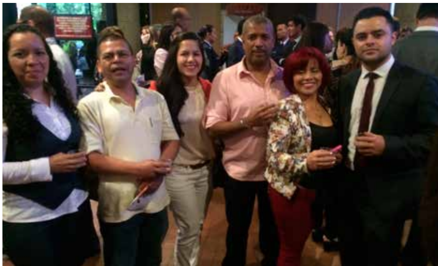
Empresarios de Manrique y Buenos Aires.