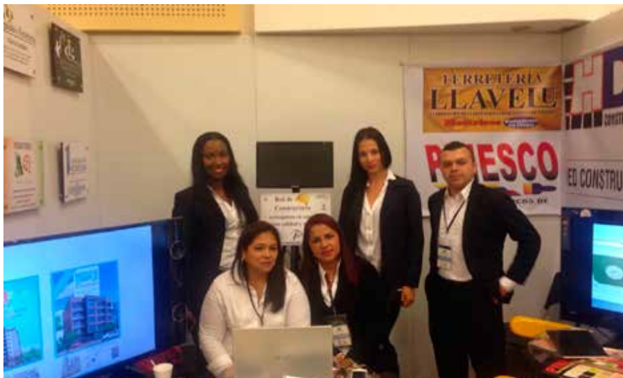
Red de Construcción, Comuna 3.