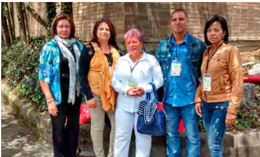
Empresarios de la comuna de Buenos Aires.