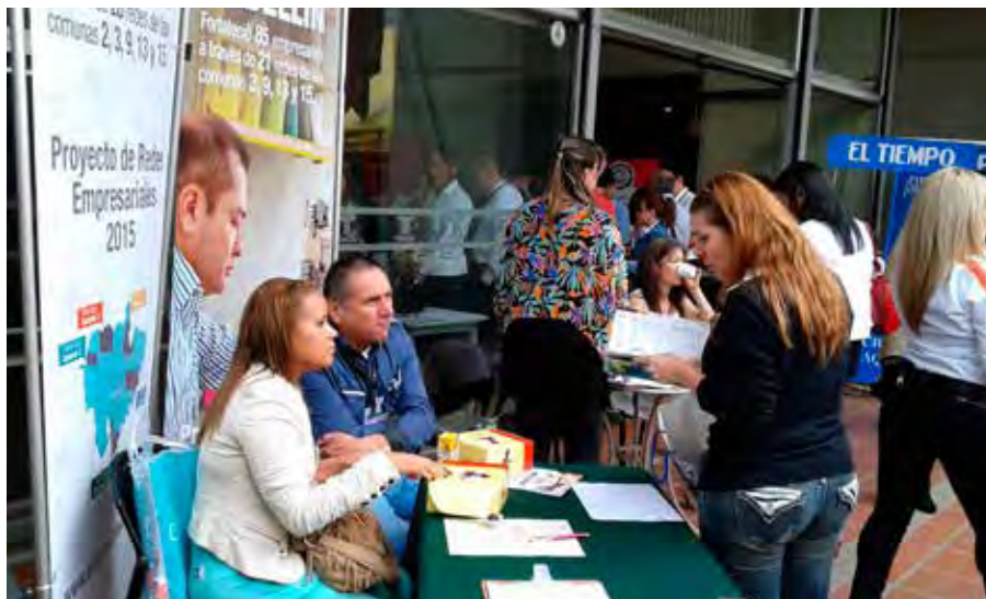
Red de Abarrotes y Viveres, vigencia 2014, Comuna 3.