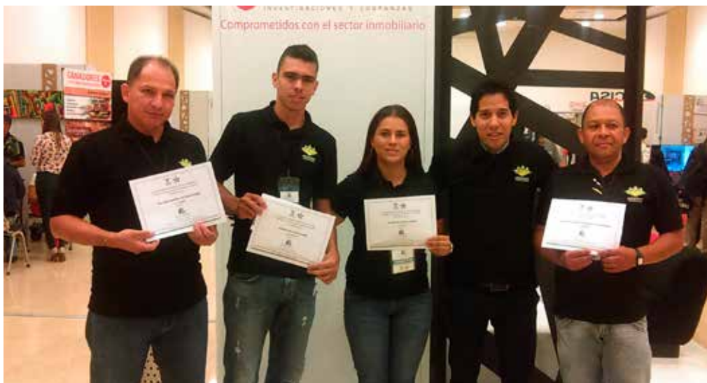
Red de Servicios Complementarios para la Construcción de la Comuna 2.

Sandra Pulgarín 570 77 09 / 310 523 93 06 sandrap640r@hotmail.com