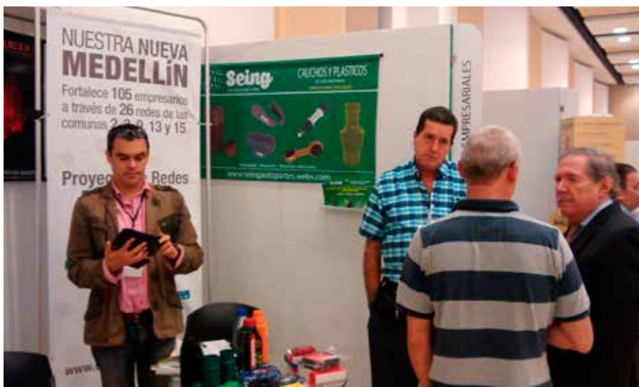
Red de Motocicletas, Comuna 9, en compañía del Presidente de Fenalco Nacional Guillermo Botero Nieto.