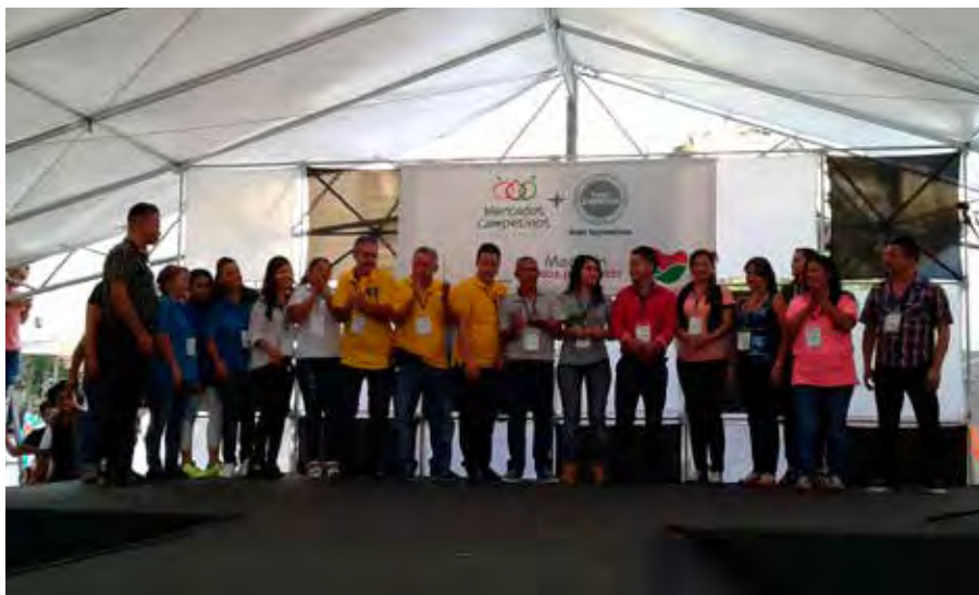
Empresarios participantes en el desfile de modas de la Feria de Redes Empresariales.