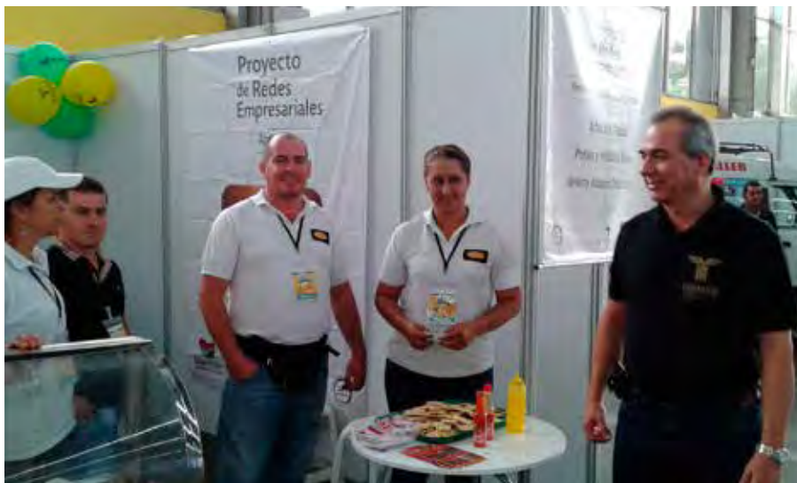
Redes de Alimentos y Abarrotes y Viveres de la Comuna 3.