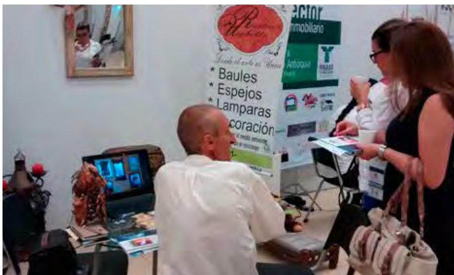
Red de Artes, Comuna 9, 2014.