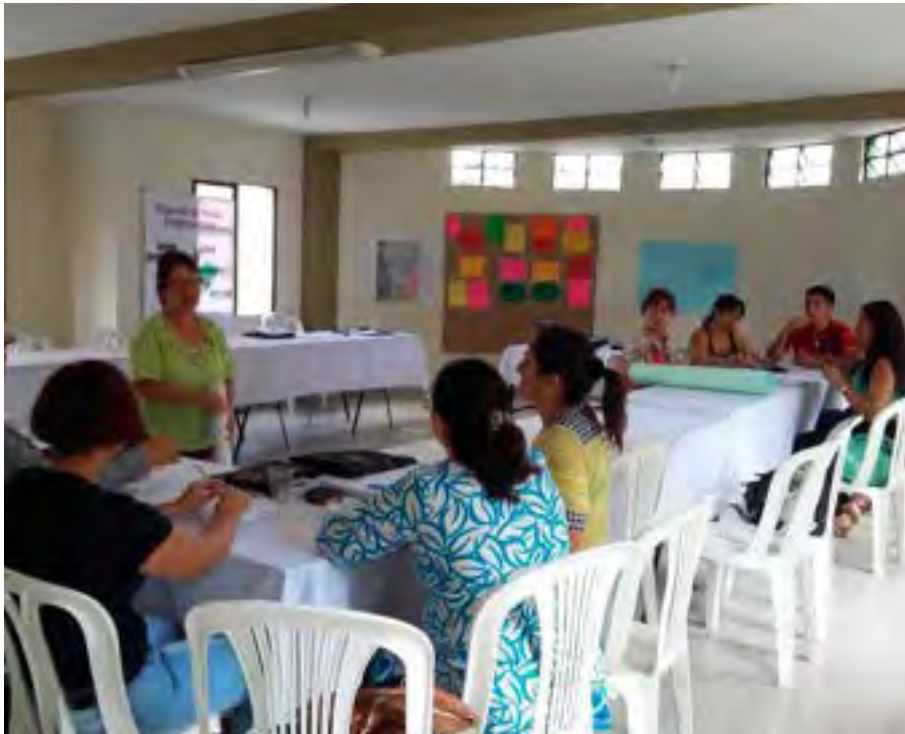
Proceso de Capacitación para el Fortalecimiento de las Redes Empresariales.