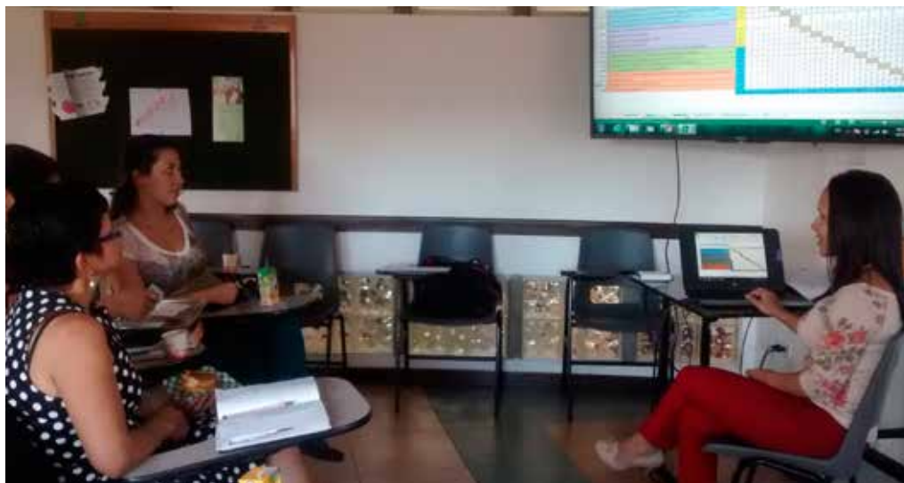
Red Marañón de Economía Solidaria de la Comuna 10.